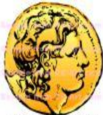
Alexander the Great

亚历山大 (Alexander the Great, 公元前 356-323年) 死时两手空空!